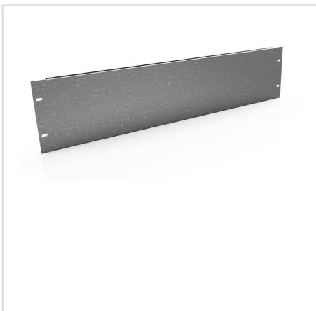
PUA płyta montażowa uniwersalna